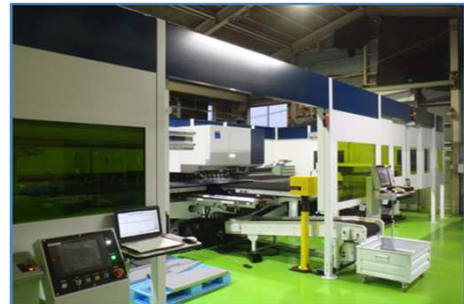
レーザーパンチプレス(複合機) TraMatic6000fiber(シートマスター付)