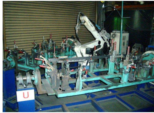
ロボット溶接機(回転ジョイナー付)